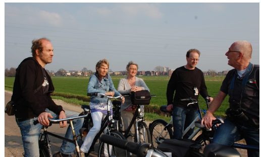
Fietstocht in het Binnenveld

Op 22 maart werd op initiatief van GroenLinks en de PvdA een Join the Pipe watertappunt op de Markt in gebruik genomen. Twee dagen later, op 24 maart, organiseerden GroenLinks Ede, Rhenen, Veenendaal en Wageningen een fiets- en wandeltocht door het Binnenveld. Daarmee vroegen ze aandacht voor het vele moois aan natuur en cultuur in dit gebied. Twee fractieleden bekeken op 18 april bij de COVRA in Zeeland hoe verwerking en opslag van radioactief afval in Nederland plaatsvindt, maar lieten zich daardoor in hun standpunt over ondergrondse opslag van kernafval niet beïnvloeden. Op 24 oktober organiseerde GroenLinks samen met de SP en de VVD een debatavond in Movie W over leegstand en antikraakbewoning in Wageningen. In november verscheen er een nieuwe editie van WageLinks Nieuws.