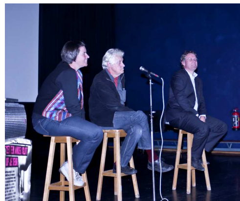
Filmdebatavond bij Movie W

Tijdens de eerste raadsvergadering van 2012 kreeg filmhuis Movie W een eenmalige subsidie van 20.000 euro, door een motie van GroenLinks. Het filmhuis kon daardoor verhuizen uit de locatie die Wageningen UR zou afstoten, naar een nieuwe zaal in 't Venster. De bijdrage had tot gevolg dat ook anderen toeschietelijker werden en het filmhuis gered werd voor Wageningen. In oktober organiseerde GroenLinks met de fracties van SP en VVD, die de motie mee hadden ingediend, een politieke film- en debatavond op de nieuwe locatie. GroenLinks wil discussie en debat in de stad ondersteunen en Movie W heeft daarbij een belangrijke functie.