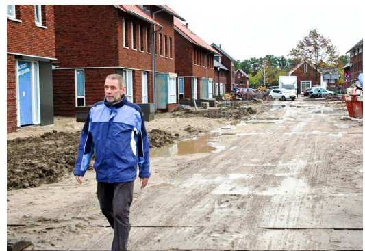
Gastvrij wonen in Kortenoord

Woningbouw moet bijdragen aan voldoende en divers aanbod van woningen voor verschillende doelgroepen. Maar het moet ook bijdragen aan de uitstraling of het gezicht van Wageningen. Wijken en gebouwen moeten passen in de omgeving. GroenLinks heeft de afgelopen jaren volop bijgedragen aan diversiteit en beeldkwaliteit. Minder appartementen, meer sociale woningbouw, meer woningen die geschikt zijn om er zo men dat wenst een leven lang in te wonen. We steunden verschillende woningbouwprojecten, zoals bijvoorbeeld DMP, Kortenoord, de Warande en Rustenburg, omdat ze met elkaar aan verschillende woonbehoefte tegemoet